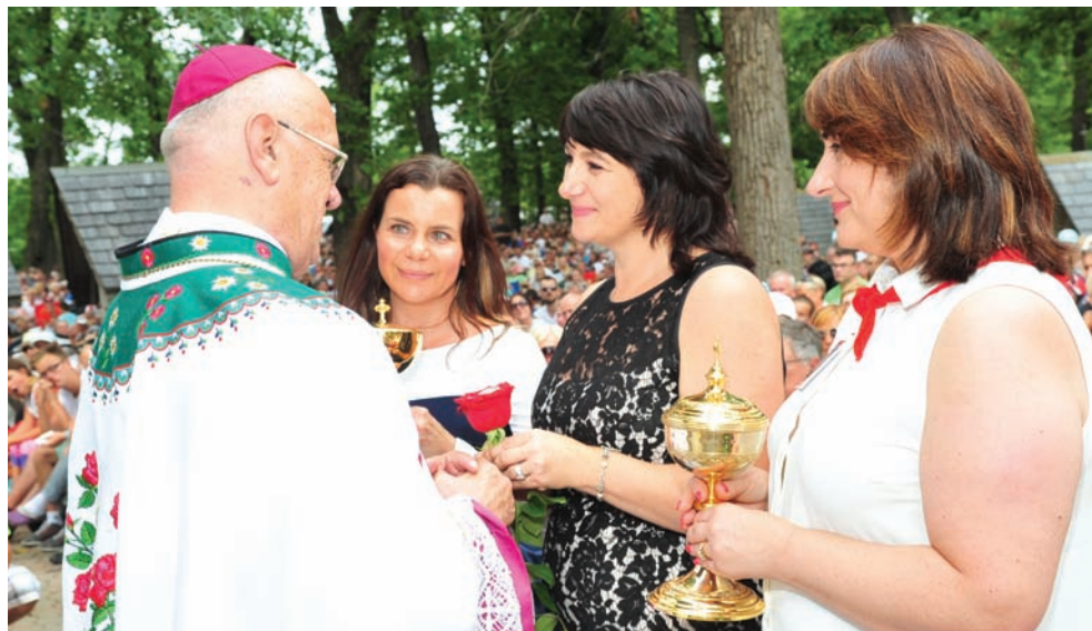
Przedstawicielki PSFCU niosą dary podczas uroczystej Mszy Św. w Sanktuarium w Merrillville, IN

Ponad dwanaście tysięcy osób uczestniczyło w niedzielnym nabożeństwie kończącym 29. pieszą pielgrzymkę z Chicago do Sanktuarium Matki Bożej Częstochowskiej w Merrillville w stanie Indiana. Po raz pierwszy największe, coroczne wydarzenie polonijne w metropolii chicagowskiej wspierała Nasza Unia.