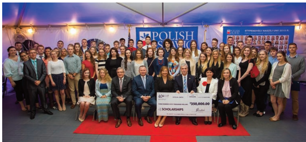
Ceremonia rozdania stypendiów PSFCU w Fairfield, New Jersey