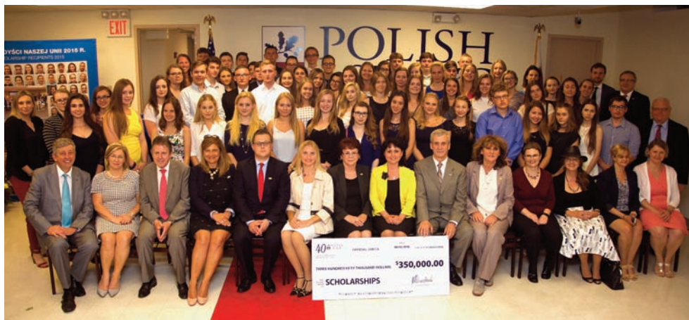
Pamiątkowe zdjęcie podczas ceremonii rozdania stypendiów PSFCU w stanie Nowy Jork

Łącznie od początku Programu Stypendialnego PSFCU w 2001 r., środki przeznaczone na stypendia przez Naszą Unię przekroczyły już 3,6 miliona dolarów. Przez wszystkie te lata ze stypendiów skorzystało