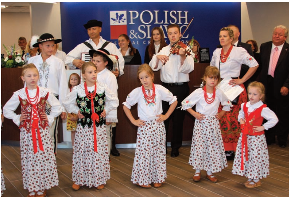
Na zakończenie uroczystości zatańczył i zaśpiewał zespół "Podhalanie"

Nowy oddział PSFCU w Wallington został zaprojektowany w sposób funkcjonalny, a jednocześnie elegancki i nowo-