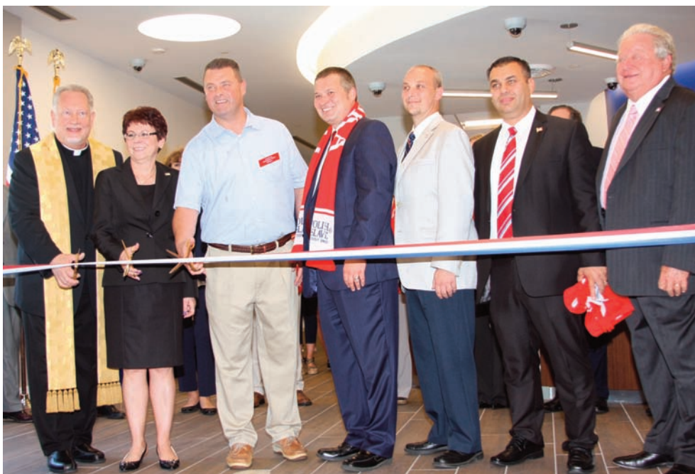
Przecięcie wstęgi podczas uroczystości otwarcia oddziału PSFCU w Wallington.