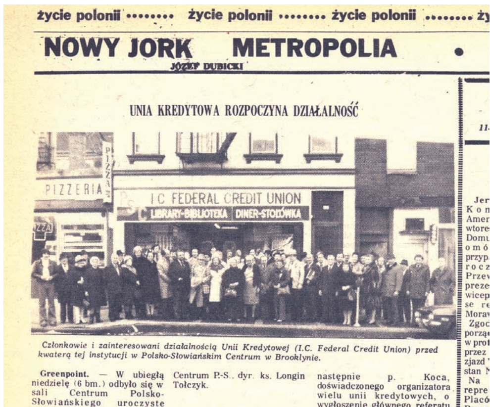
Członkowie i zainteresowani działalnością Unii Kredytowej (I.C. Federal Credit Union) przed kwaterą tej instytucji w Polsko-Słowiańskim Centrum w Brooklynie.

W jedenastym roku działalności Nasza Unia symbolicznie przekroczyła rzekę Hudson. W 1987 r. otworzyliśmy nasz drugi oddział w miejscowości Union w stanie New Jersey. Kolejne lata to dalsza ekspansja, powstały nowe oddziały: przy Kent Street na Greenpointie (1992), Boro Park na Brooklynie (1996) oraz w miejscowości Clifton, New Jersey (1996).