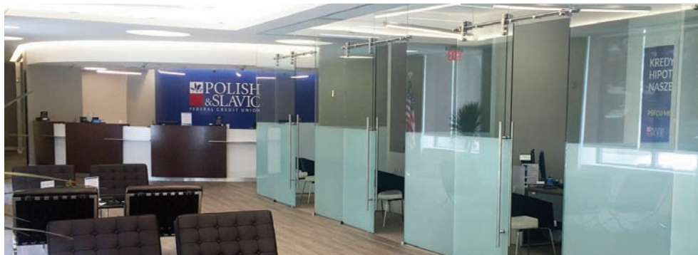
Wnętrze oddziału PSFCU w Wallington, NJ

Po raz pierwszy Polsko-Słowiańska Federalna Unia Kredytowa będzie głównym sponsorem Pieszej Polonijnej Pielgrzymki Maryjnej. Odbędzie się ona w dniach 13-14 sierpnia br. a pielgrzymi pokonają tradycyjnie trasę z kościoła św. Michała w południowym Chicago, poprzez Sanktuarium Matki Bożej Ludźmierskiej w Muster, Indiana aż do Sanktuarium Matki Bożej Częstochowskiej w Merrillville, Indiana. Serdecznie zapraszamy do udziału w pielgrzymce, którą zakończy uroczysta msza niedzielna o godz 14:00 dla kilku