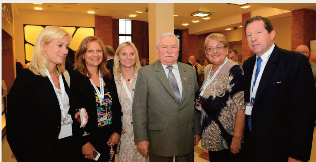
Spotkanie przedstawicieli Rady Dyrektorów i Komisji Nadzorczej P-SFUK z Prezydentem Lechem Wałęsą