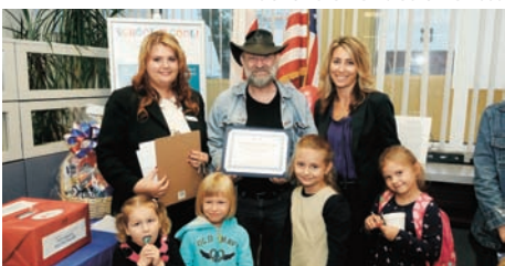
Zwycięzca nagrody $100 w Boro Park