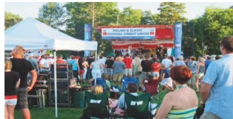
Festyn Radia 1030 w Chicago

Podczas wszystkich imprez Nasza Unia starała się pozyskać nowych Członków oferując specjalne nagrody dla tych, którzy zdecydowali się otworzyć konta na miejscu. Osoby będące już Członkami P-SFUK mogły uczestniczyć w losowaniach specjalnych nagród.