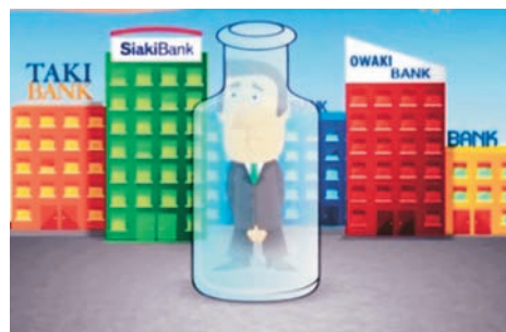
Scena z reklamy kart kredytowych

reklam telewizyjnych, opartych na wykorzystaniu polskich idiomów. Reklamy te zawierają zabawną animację i sceny obsługi klienta, sfilmowane w naszych oddziałach. Pierwsza reklama wykorzystująca idiom „nie daj się nabić w butelkę” promuje karty kredytowe, druga, oparta na „nie daj się robić na szaro”, promuje pożyczki hipoteczne, a trzecia, zbudowana wokół idiomu „nie daj się wykołować”, promuje kredyty samochodowe. Sukces promocji jest już widoczny, a widzowie dzwonią do Naszej Unii z bardzo pochlebnymi (i humorystycznymi) komentarzami.