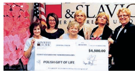
Zarząd Polskiego Daru Życia odbiera dotację