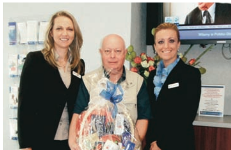
Jeden ze zwycięzców i Zarząd oddziału w Clifton

Polish Gift of Life jest organizacją z ponad trzydziestoletnią tradycją; dzięki pomocy fundacji, ponad 350 polskich dzieci uzyskało ratującą życie pomoc medyczną w USA. Pracownicy organizacji to wolontariusze nie otrzymujący finansowego wynagrodzenia za swoją pracę. Większość funduszy to indywidualne dary ludzi dobrej woli.