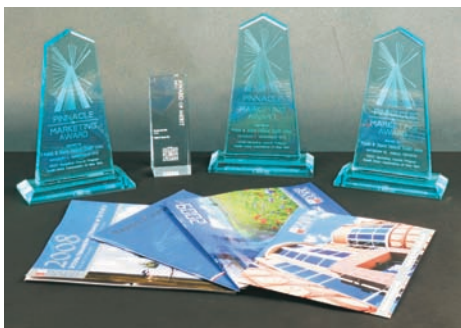
Nagrody marketingowe zdobyte przez P-SFUK

Polsko-Słowiańska Federalna Unia Kredytowa wygrała zaszczytną nagrodę „Złoty Luster” w dorocznym konkursie marketingowym organizowanym przez CUES (Stowarzyszenie Członków Zarządów Unii Kredytowych). W konkursie wzięły udział wszystkie wiodące amerykańskie unie kredytowe, a materiały promocyjne, które wygrały nagrody, można zobaczyć na stronie www.cuesgma.org