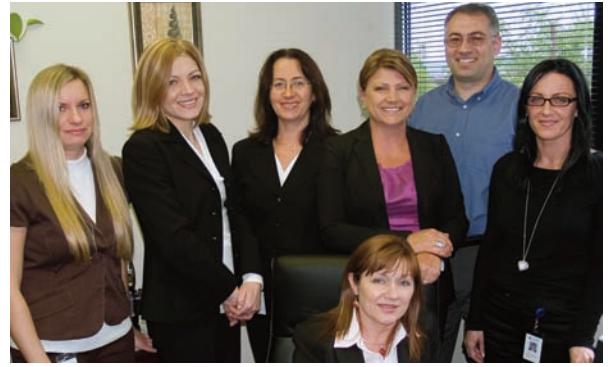
Pracownicy Działu Obsługi Pożyczek

Przedstawiamy Państwu Dział Obsługi Pożyczek P-SFUK. Każdy, kto kiedykolwiek zaciągnął w Naszej Unii pożyczkę na dom, personalną lub samochodową, był w pewnym momencie obsługiwany przez pracowników tego działu – udzielają oni bieżących informacji na temat stanu danej pożyczki, przyjmują płatności napływające pocztą, czuwają nad poprawnością wymaganych dokumentów, monitorują ważność wszelkich ubezpieczeń oraz weryfikują, czy podatki